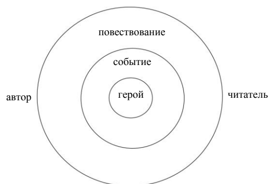
Рис. 1. Эпика Fig. 1. Epic